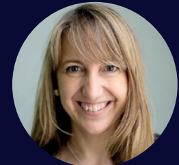
Montse Guardia Presidenta del Consell Social, Universitat Politècnica de Catalunya