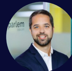
Xavier Capellades CEO del Grup Parlem

Dimecres 13 i Dijous 14 de novembre de 2024