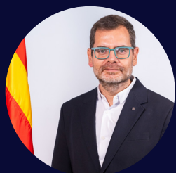
Oriol Alcoba Director general d'Indústria, Generalitat de Catalunya

Identificar l'impacte de la IA i la ciberseguretat en les pimes i grans empreses del territori. Detectar oportunitats per a la digitalització d'aquests sectors industrials clau a Catalunya.