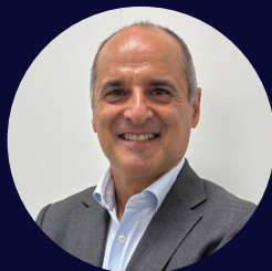
Xavier Urios Cap de l'Assessoria Jurídica de l'Autoritat Catalana de Protecció de Dades