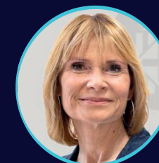
Lluïsa Moret Presidenta, Diputació de Barcelona