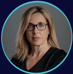
Moderadora Angels Fitó Rectora, Universitat Oberta de Catalunya