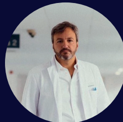
Dr. Nacho Revuelta Hospital Clínic de Barcelona