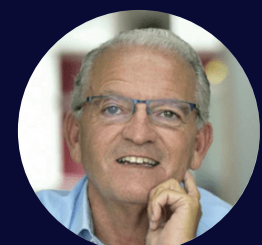
Miguelo Betancor Doctor en Psicopedagogia i catedràtic de Teoria i Història de l'Educació, Universidad de las Palmas de Gran Canaria

Dimecres 13 i Dijous 14 de novembre de 2024